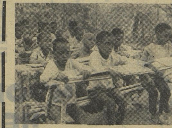
СЕГОДНЯ ДЕНЬ ОСВОБОЖДЕНИЯ АФРИКИ

Африканцы строят свою дома, больницы, школы, подалые от леса. Трава вокруг тщательно выкашивается. Делается это для того, чтобы около людей было поменьше комаров — носителей тропической малярии, чтобы в их жилища не заползали змеи.