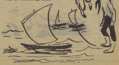
Рис. Г. АЛЕКСАНДРОВОП

Словно ласточка, легка Торопливая река. По камням с высоких гор Вылетает на простор. — Не спеши, река, постой, Поиграй часок со мной. А река мне на бегу Отвечает: — Не могу! Люди ждут моей воды, Ждут зелёные сады. Знаю много я чудес, Я кручу турбины ГЭС. И ещё меня вдали Ждут большие корабли... Хочешь на море взглянуть? Собирайся быстрее в путь. Зря меня ты не зови — Сделай лодку и плыви!